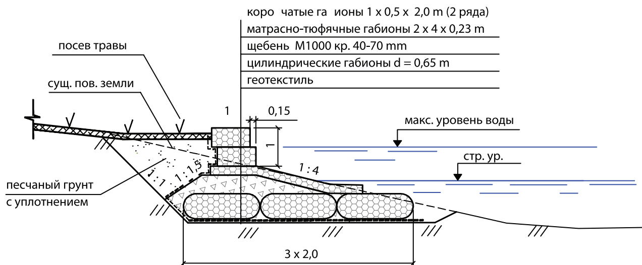
Объем основных работ на 100 м берегоукрепления